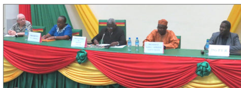
Coté tribune : les officiels...

Le réseau Afrique Verte international (APROSSA Afrique Verte Burkina, AMASSA Afrique Verte Mali, AcSSA Afrique Verte Niger et Afrique Verte) a organisé une bourse céréalière internationale à Ouagadougou, les 13 et 14 décembre.