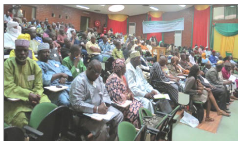
Les opérateurs : producteurs, acheteurs ruraux des zones déficitaires, commerçants, transformatrices...

Conférences-débats, confrontation de l'offre et de la demande, expositions-ventes ont marqué cette bourse céréalière de Ouaga qui s'est tenue CBC (Conseil burkinabè des chargeurs). Au cours de ces 10 dernières années, les politiques sectorielles et le cadre macro-économique ont connu de profondes