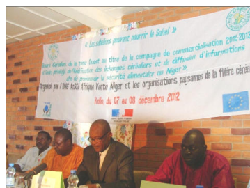
Bourse de Kollo