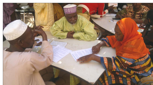
La signature des contrats !

La bourse internationale aux céréales contribue à lever des contraintes entravant la commercialisation et la circulation des biens agricoles.