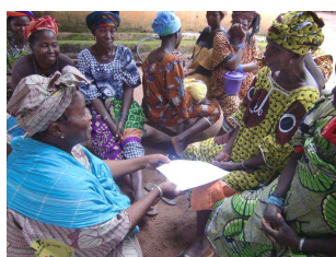
Remise des contrats signés entre le PAM et les représentantes de l'Union des femmes de Farakala

« La conjugaison des efforts de l'Etat et des partenaires au développement a eu un impact positif sur la sécurité alimentaire des populations, notamment rurales, qui étaient les plus affectées. Les multiples actions entreprises (distribution gratuite, vente de céréales à prix modérés, travail contre argent...) ont pu contenir la crise dans une proportion moindre. Aussi le bon niveau de développement des cultures présage une évolution positive dans les jours à venir. Il faut noter que la coordination des actions sur le terrain a été meilleure que par le passé, même si des efforts restent à faire encore dans ce sens ».